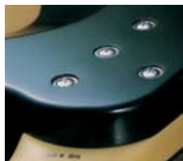
Винтовое крепление грифа

Основных методов крепления грифа к корпусу гитары три. Первый и наиболее часто встречающийся – винтовой. Количество винтов разное: от четырёх до шести. Зависит от того, насколько глубоко гриф утоплен в корпус бас-гитары, и насколько он широк относительно количества струн. Второй вариант – это когда гриф бас-гитары и часть корпуса – одно целое. Его корпусная часть (немного шире, чем гриф) делит инструмент на две половины, как бы проходя сквозь корпус гитары. Отсюда и название такого варианта – сквозной. Третий вариант, встречающийся очень редко, когда гриф приклеивают к корпусу, при этом очень важно правильно рассчитать угол вклейки, т.к. возможность его регулировки соответственно исключается.