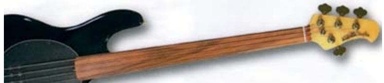
Безладовый гриф без разметки

Размеченный имеет имитацию ладов в виде пластмассовых вставок, что помогает лучше ориентироваться при игре и постановке пальцев т.к. несоблюдение пальцами правильных интервалов (например, за двенадцатым ладом) приводит к ощущению расстроенного инструмента. Намного проще обстоит дело с игрой на размеченном грифе, где интервалы обозначены ладами. И тот, и другой вариант грифа (ладовый или безладовый) могут различаться по своей длине, а значит, могут иметь разное расстояние между ладами. Стандартное расстояние или стандартная мензура бас-гитары – 39". Этого стандарта придерживается большее число производителей. Осталось добавить, что количество ладов также подлежит классификации. Наиболее часто встречающиеся варианты – это число ладов от девятнадцати до двадцати