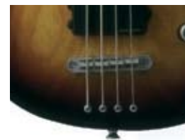
Сквозное крепление струн