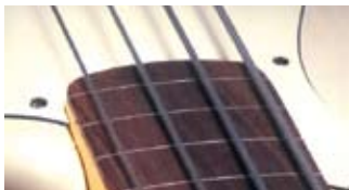
Безладовый гриф с разметкой

Здесь речь идёт о принципиально разных вариантах исполнения накладке грифа. Существует два варианта – ладовый и безладовый. Второй встречается значительно реже и в свою очередь может дополнительно делиться на размеченный и неразмеченный. Неразмеченный имеет сходство с контрабасом или скрипкой – гриф гладкий, без нанесения каких-либо «опознавательных знаков».