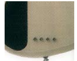
Сквозное крепление струн (тыльная сторона)